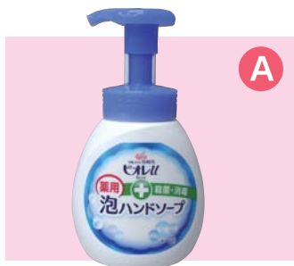
ビオレU 泡ハンドソープ