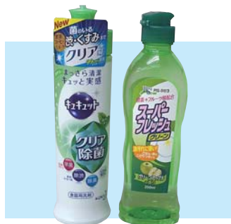
キュキュット+スーパーフレッシュSet